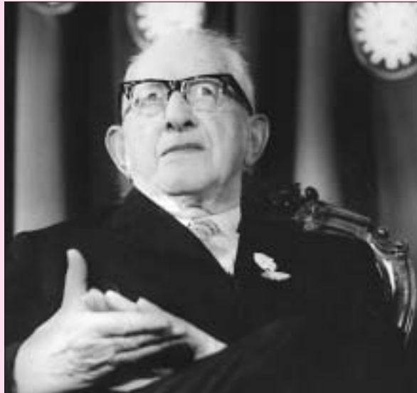
Měrcin Nowak-Nječorński

hrodze a wobkedźbowach jeho při rysowanju. Na polcach bě wjele knihow, mjez nimi tež česke. Wón powědaše mi wo swojim studiju w Praze a zwěsćich,