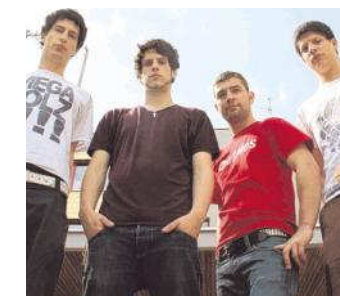
The Avayou spielen als Support Act für „Fights & Fires“ im Step avayou

Fights & Fires: 20. 2., 20 Uhr, Step, Völkermarkt (www.bystep.at).